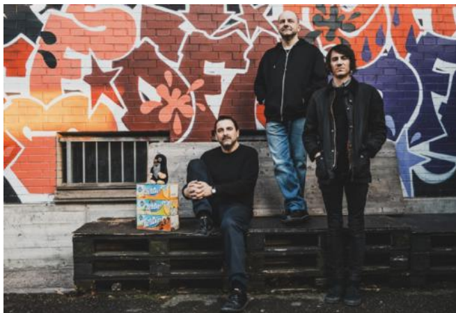
Giovedì sera l'appuntamento con gli Offlaga Disco Pax, a vent'anni da «Socialismo Tascabile»

Absolutamente no. I risultati sono andati molto oltre le nostre attese, è arrivata molta più gente di quella che ci trovavamo davanti ai vecchi tempi. Abbiamo dovuto raddoppiare a Torino, Roma e Milano, dove personalmente avevo il timore che un locale come i Magazzini Generali fosse troppo per noi... Invece lo abbiamo esaurito due sere e a settembre suoneremo al Castello Sforzesco. Non potevamo immaginare che in questi 11 anni di assenza la nostra musica avesse aggregato sul web un pubblico nuovo, ragazzi che ai tempi di «Socialismo Tascabile» erano ancora all'asilo o alle elementari e che ora ci troviamo sotto il palco insieme ai «lupi grigi», ai fan